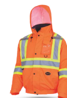
ORANGE HAUTE VISIBILITÉ