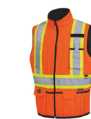
ORANGE HAUTE VISIBILITÉ