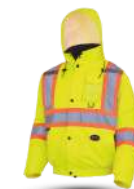
JAUNE/VERT HAUTE VISIBILITÉ