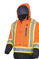
ORANGE HAUTE VISIBILITÉ